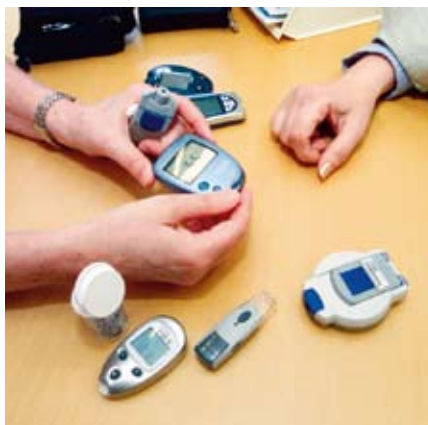
Blodsockermätare är viktiga för att diabetiker ska veta hur mycket insulin de behöver. Prediktorn minskar behovet av antalet mätningar.

SOM EU-PROJEKT MÅSTE det redan vid ansökan ha en exploateringsplan för att garantera att resultaten kommer ut i praktisk och kommersiell användning. Enligt projektplanen får apparaten som ska bli resultatet inte försämra vården för någon utan ge en väsentligt förbättrad komfort för majoriteten, vilket kräver en stor säkerhetsapparat. Man hoppas både